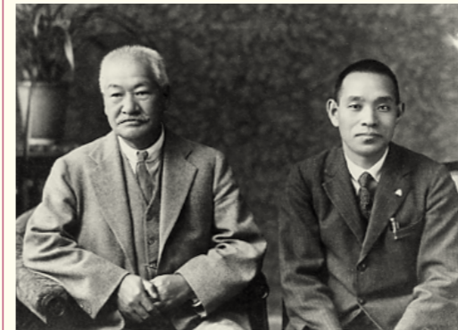
徳富蘇峰氏(左)と武美(右)