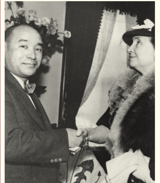
武美(左)とヘレン・ケラー女史(右)